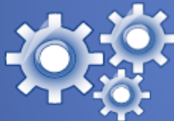
Appliquer votre style

2. Regroupez les éléments en « slides » et générez votre catalogue