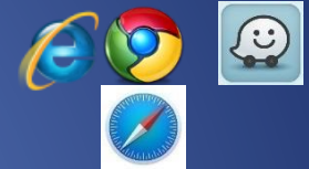
Liens / websites

2. Regroupez les éléments en « slides » et générez votre catalogue